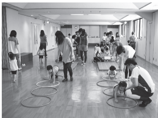
▲わくわく親子体操教室