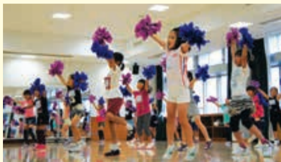
ちびっこチアガールも一生懸命練習を重ねています。