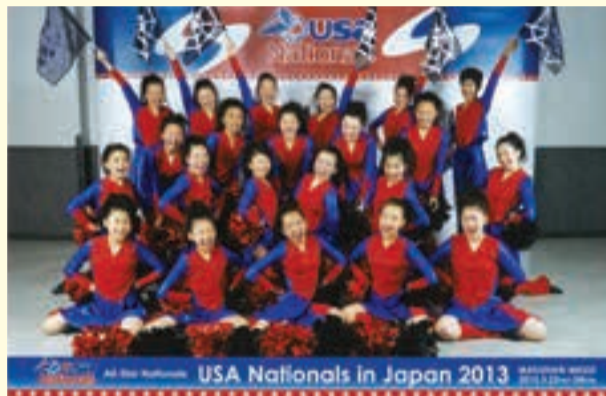
東砂スポーツセンター LITTLE WINGS