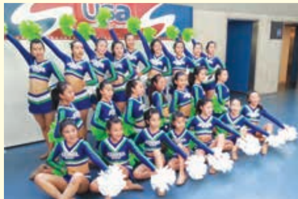
亀戸スポーツセンター STARRY WINGS

また、10月の体育の日には亀戸スポーツセンターにて、キッズチアを含めたキッズダンス発表会も開催予定です。大会に出場しているチームも出場する予定です。詳細は9月15日発行予定の次号の紙面でお知らせします。お楽しみに♪