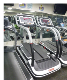
「トレッドクライマー」