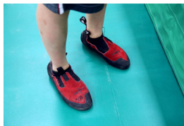
写真上 ハーネス 写真右 クライミング専用シューズ