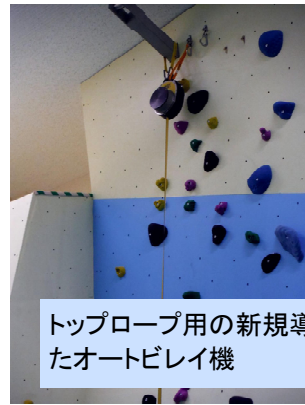
トップロープ用の新規導入したオートビレイ機