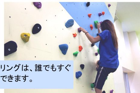
ボルダリングは、誰でもすぐに挑戦できます。