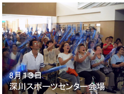
8月13日 深川スポーツセンター会場