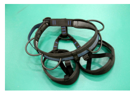
トップロープ用のハーネスや専用シューズも初回利用につき、無料で貸し出し。