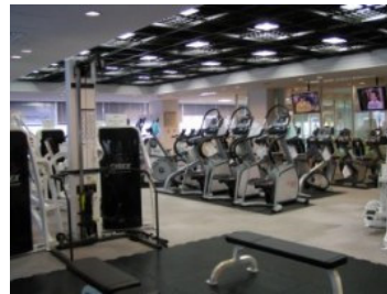
深川北スポーツセンタートレーニング室