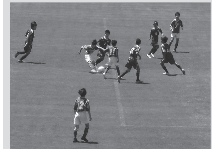
区民サッカー大会(少年の部)