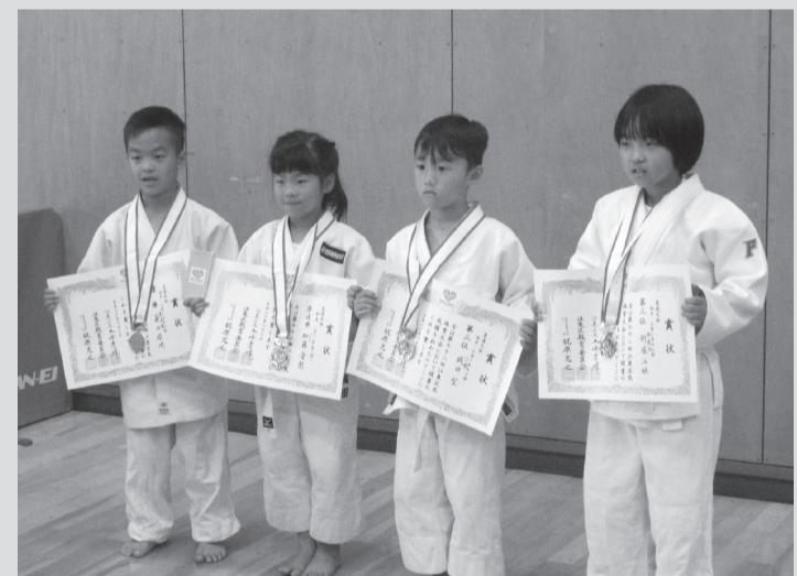
区民柔道大会(幼年・小学1年生の部)

※今後は、軟式野球(一般)、ラジオ体操、バドミントン、水泳、陸上競技、ゴルフ、ビーチボール、クレー射撃、バスケットボール(小学生)、武術太極拳、ダンススポーツ、ライフル射撃、エアロビック、駅伝競走の各大会が予定されています。