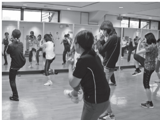
▲エアロボクシング