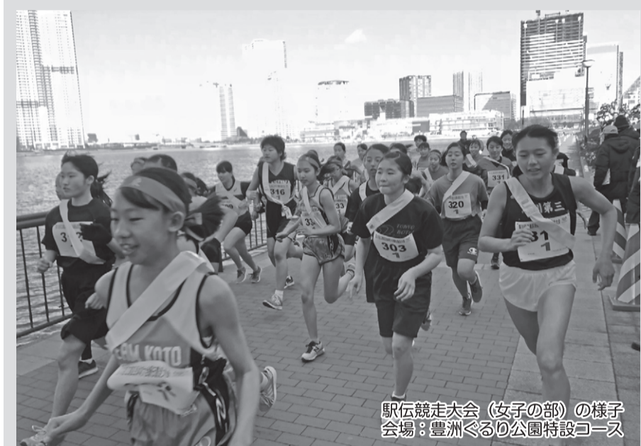
駅伝競走大会(女子の部)の様子 会場:豊洲冬の公園特設コース

第73回(平成31年度)江東区民体育大会の申込受付が2月21日から始まります。詳細は、江東区健康スポーツ公社のホームページをご覧ください。