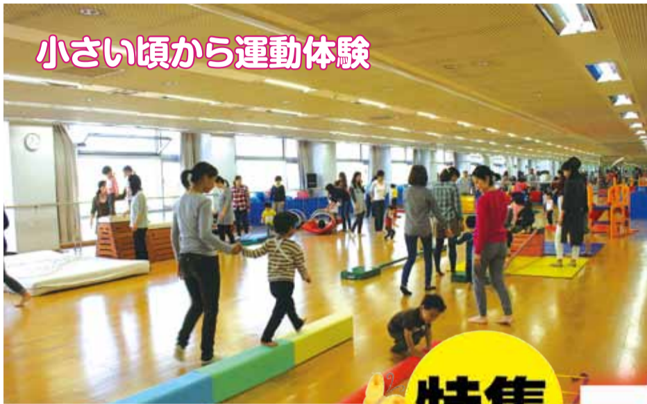
小さい頃から運動体験