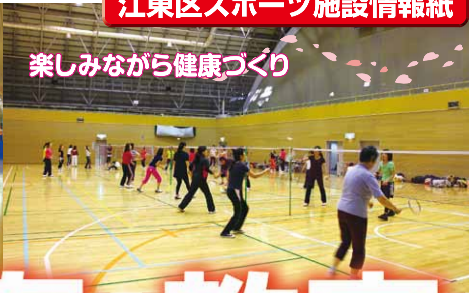
楽しみながら健康づくり