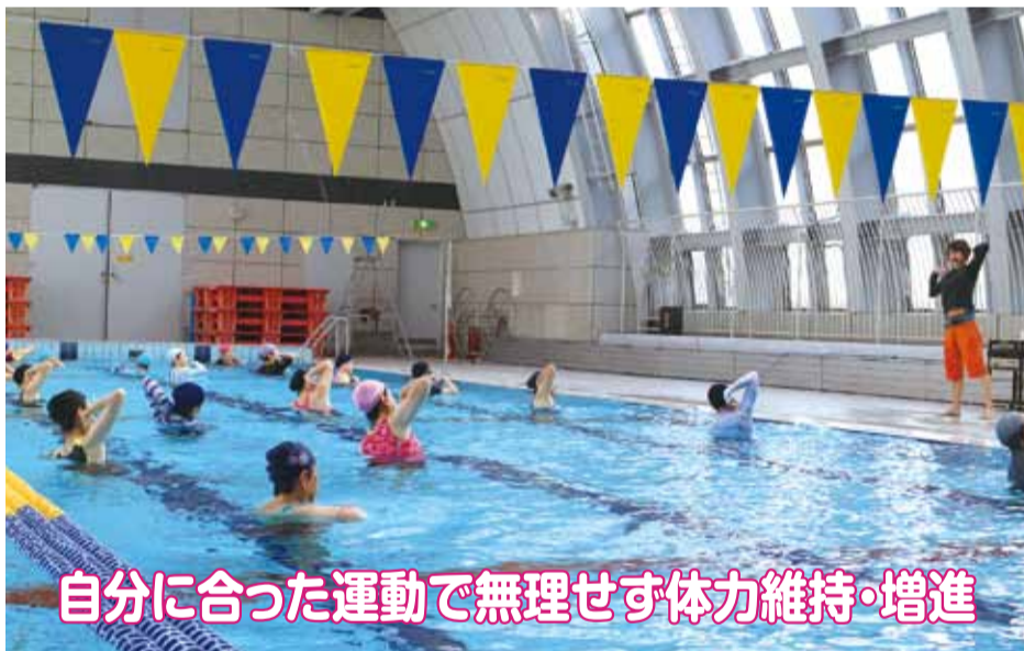
自分に合った運動で無理せず体力維持・増進

自分にぴったりの運動に出会えるチャンス!世代や体力、目的に応じて多彩なプログラムをご用意しています。