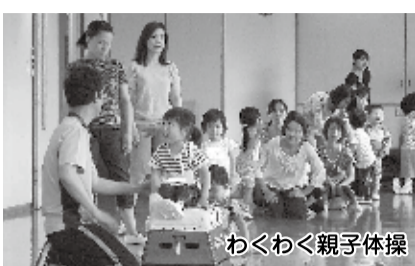
わくわく親子体操