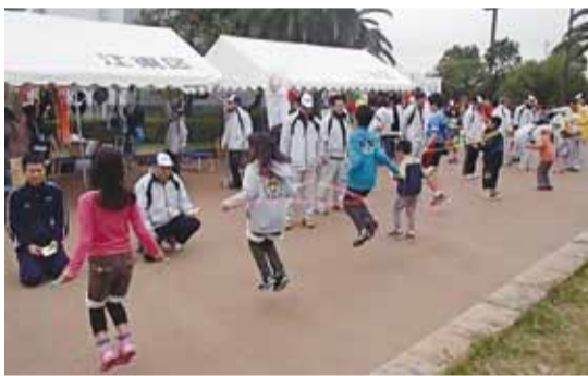
【子どもスポーツデーで指導にあたるスポーツ推進委員】

「スポーツ推進委員」は、区民の皆様がそれぞれの体力や年齢、技術、興味、目的に応じて、いつでも、どこでも、いつまでもスポーツに親しむことができる生涯スポーツ社会を実現することを目指して活動をしています。あなたの街のスポーツ推進委員に気軽にお声掛けください。