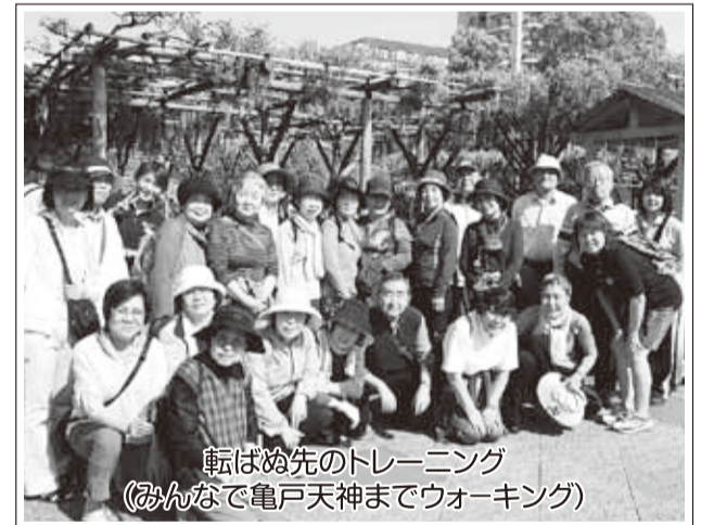
転ばぬ先のトレーニング (おんなで亀戸天神までウォーキング)