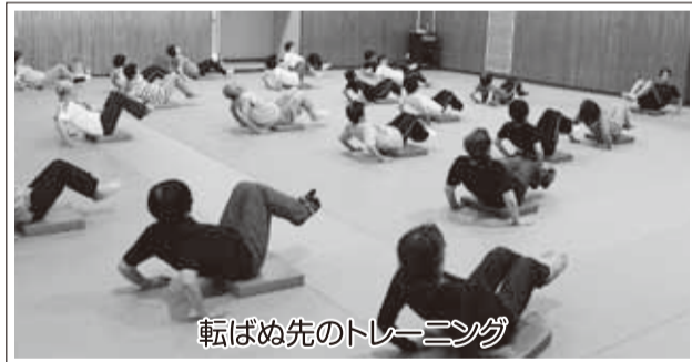
転ばぬ先のトレーニング