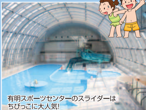
有明スポーツセンターのスライダーはちびっこに大人気!