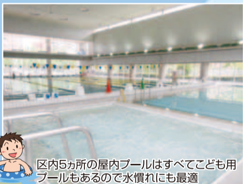
区内5か所の屋内プールはすべてこども用プールもあるので水慣れにも最適

江東区内には5か所の屋内プールとひとつの屋外プールがあることをご存知でしょうか? それぞれに特色のあるプールを楽しみながら、地域密着型の涼でこの夏の暑さを乗り切りましょう。