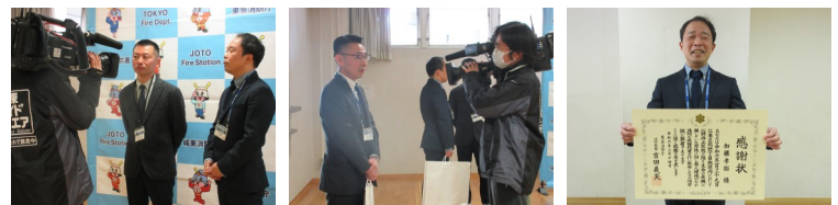
表彰式の様子は、江東ワイドスクエアにて放送される予定です(2月25日(日)~3月2日(土))。

(公財)江東区健康スポーツ公社は、引き続きみなさまが安全安心に区民体育館をご利用いただけるよう努めてまいります。