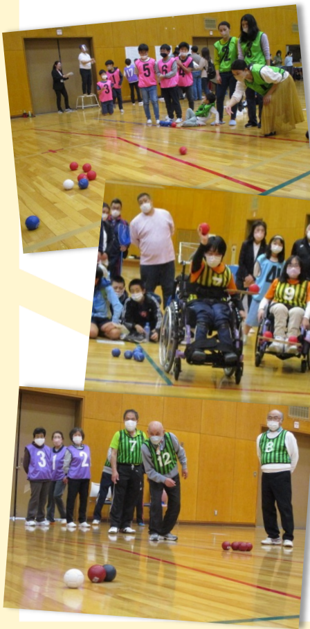
◀▲ 第1回大会（令和5年3月開催）の様子。性別、年齢、障害の有無を越えてたくさんのチームが集まり、ポッチャを通じて楽しく交流できる機会となりました。