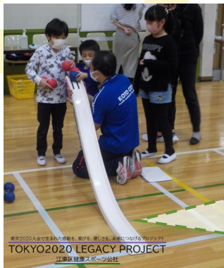
TOKYO2020 LEGACY PROJECT 江東区健康スポーツ公社

前号で紹介したシンプルかつ奥深いゲーム性に加えて、ポッチャが若者男女を問わず幅広く楽しまれている理由の一つに、「障害の度合いに合わせた柔軟なルール設定」が挙げられます。今回は、ポッチャならではの道具について、ご紹介いたします。