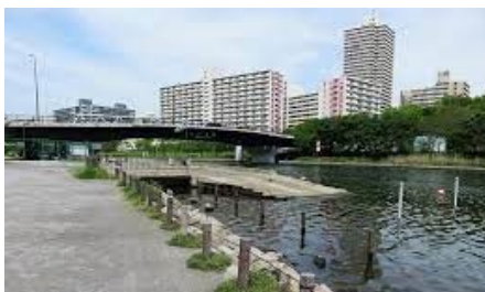
③旧中川・川の駅(中川船番所)