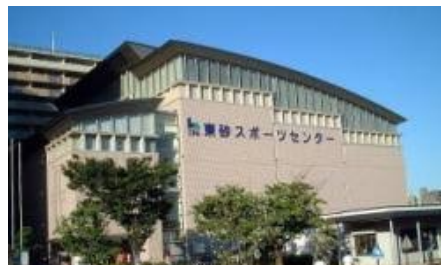
①東砂スポーツセンター(発着場所)