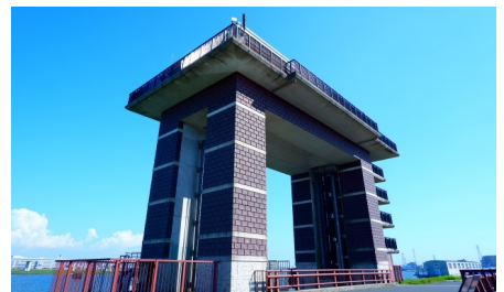
②荒川ロックゲート