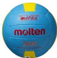
<今大会使用球イメージ>

※昨年度使用のボールと異なります。（今年度規格 molten ドッジボール 軽量3号検定球 D3C5000-L）