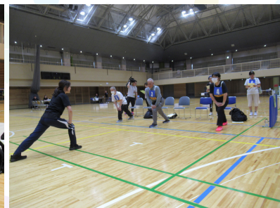
※令和7年度区民体力テスト会場での様子